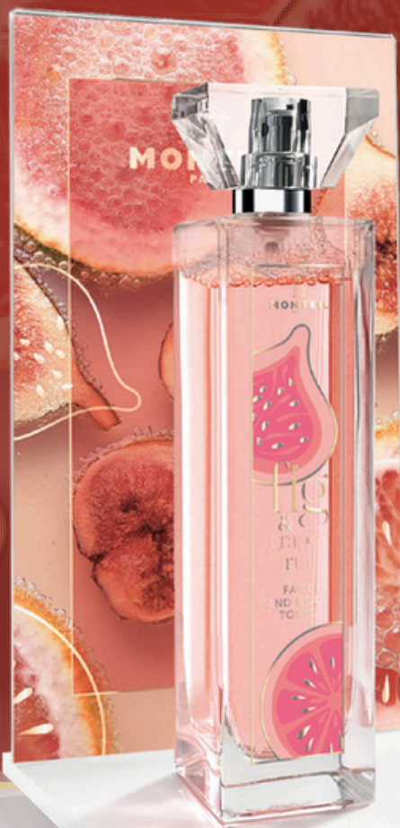
FIG & GRAPEFRUIT FACE & BODY TONIC

Sprankelende grapefruit en de sensuele zoetheid van vijg – deze geur roept herinneringen op aan zonovergoten tuinen en geeft de huid pure vitaliteit. De nieuwe Fig & Grapefruit Face & Body Tonic is meer dan een verzorgingsproduct: het is een luxemoment voor elke dag. Vooral rond Valentijn is deze tonic een ideale metgezel en een prachtig geschenk – modern, elegant en vol uitstraling.